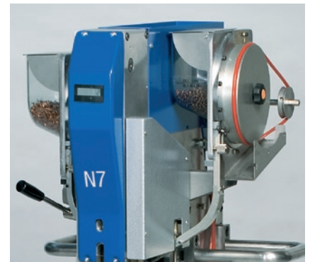
2 Artikelmagazine mit Entleerungssystem Two hopper systems with emptying system

Copyright 2010 - YKK STOCKO FASTENERS GmbH, Wuppertal/Germany