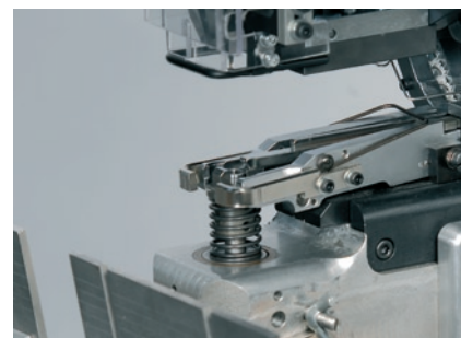
Große Durchlasshöhe und Ausladung (Einlegetiefe) Guter Zugang zum Ansetzwerkzeug und zur unteren Artikelzuführung Great clear working height and throat depth Easy access to attaching tool and lower article guide