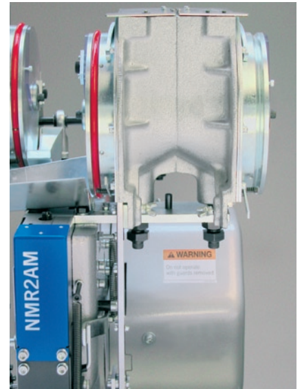
Abgebildete Ansetzmaschine ausgerüstet mit 3 Artikelmagazinen